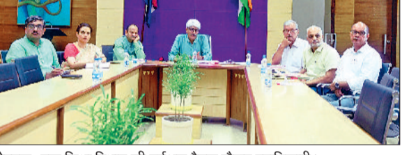
रोहतक। उच्च शिक्षा विभाग की वचुअल बैठक मौजूद पदाधिकारी।