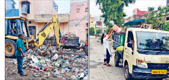
नगर निगम ने कूड़ा उठाने के लिए किए अतिरिक्त प्रबंध

पर भगवान का दर्जा दिया गया है, उसी के अनुरूप डॉक्टर अपने कर्तव्य का निर्वहन करें। इलेक्ट्रोहॉम्योपैथी बेहतरीन चिकित्सा पद्धति है, जिसकी दवाओं का शरीर पर कोई साइड इफेक्ट नहीं है। ग्रोवर ने आश्वासन दिया कि